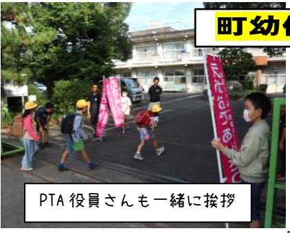
PTA 役員さんも一緒に挨拶