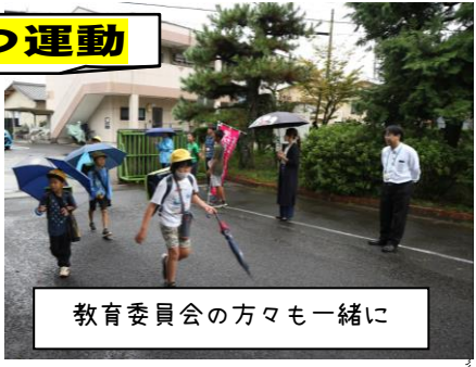
教育委員会の方々も一緒に

町幼保小中高一斉あいさつ運動では、多くの方々にご協力をいただきありがとうございました！