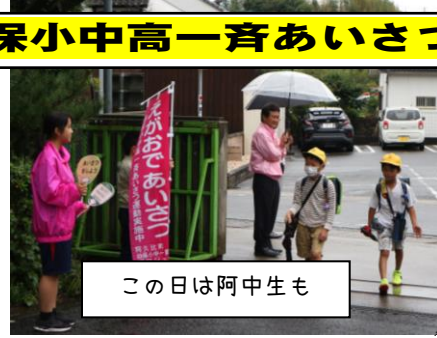
この日は阿中生も