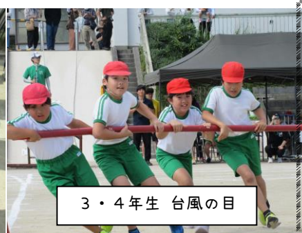
3・4年生 台風目の目