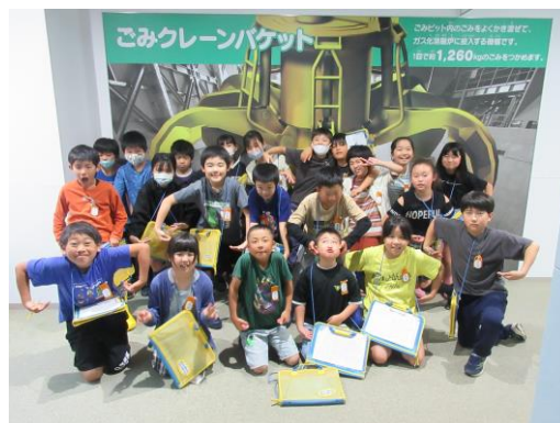
5/27(火) クリーンセンター 原寸大のクレーンの写真の前で