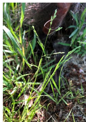
30 スズメノカタビラ