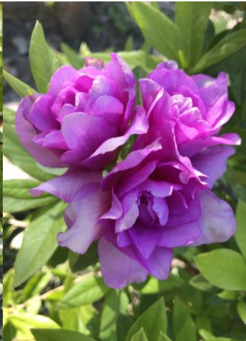
35 ツツジ (八重)