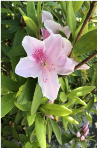
34 ツツジ(うすピンク)