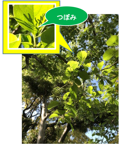
33 ヒトツバタゴ (つぼみ) * 白い花がさきます。