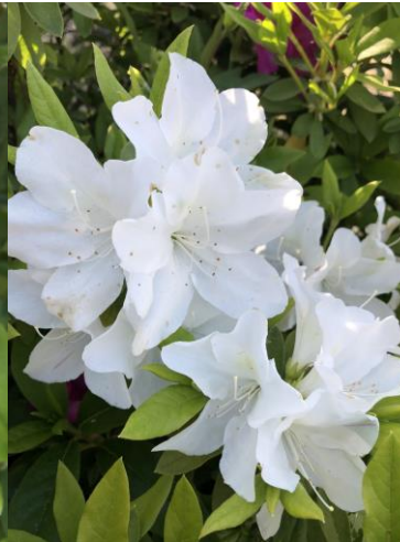
36 リュウキュウツツジ