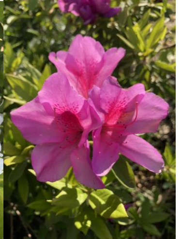
37 ツツジ (こいピンク)