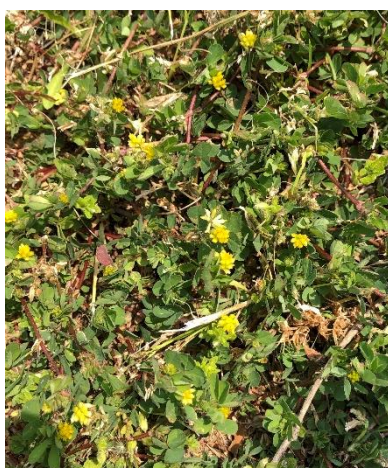
29 コメツブツメクサ